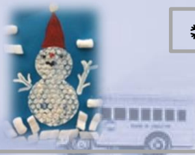
❄ Des bonhommes de neige