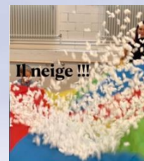
❄ Le « parachute à neige »