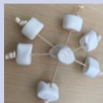
❄ Des flocons de guimauves

La maternelle a consacré une matinée autour de plusieurs ateliers sur le thème de l'hiver :