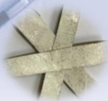
❄ Des flocons en carton